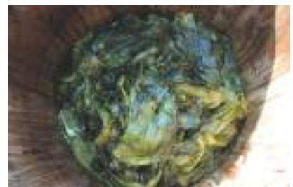
堀池高菜漬の復活