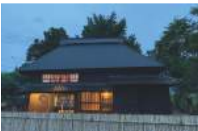
藁ぶき古民家和楽