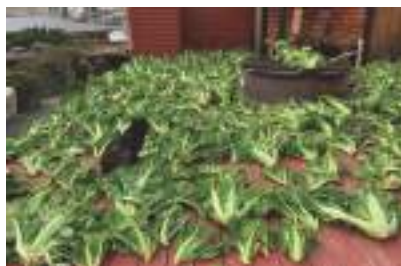
固定種の種トレーサビリティ