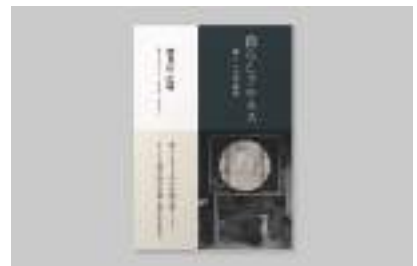
著書 暮らしフルネス