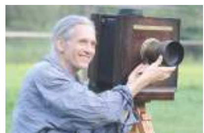
日本文化研究者 エバレットブラウン氏